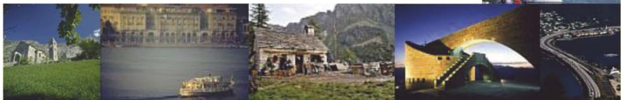
Images de Tessin/Suisse